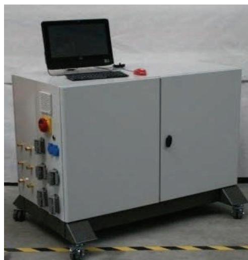
PLC/PC 制御コントローラー